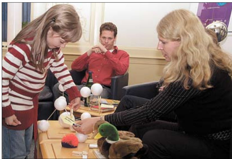
Üben mit dem Gedankenmolekül.