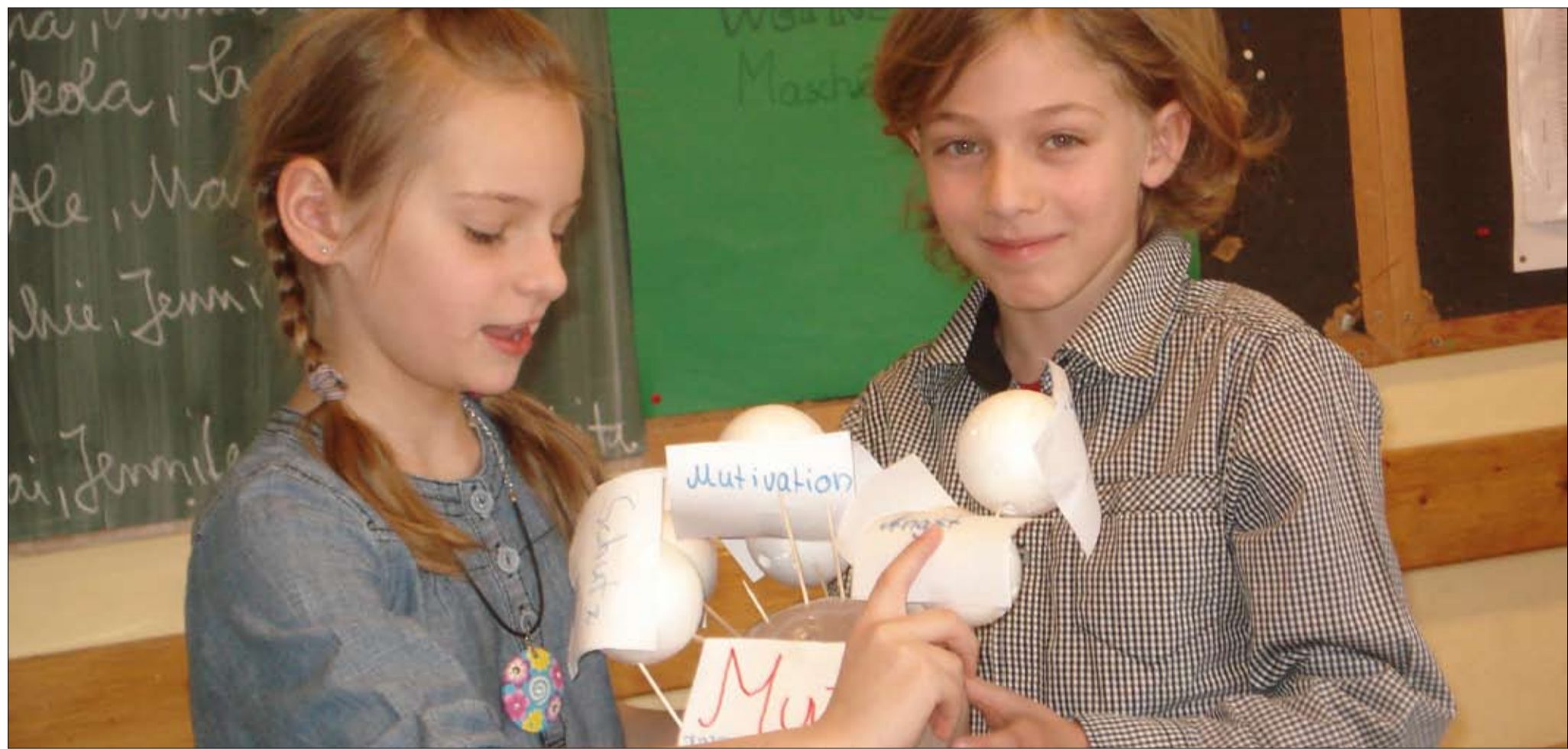
Was macht Mut aus? Dazu schufen die Kinder der St. Ursula-Grundschule Mutmoleküle. Die kleinen Kugeln zeigen, was für die Kinder zu echtem Mut dazugehört.