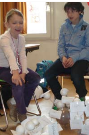
Im Gespräch: Im Stuhlkreis entwickeln die Kinder ihre eigenen Ideen und begründen sie vor den andern.

Unter den angegebenen Internet-Adressen finden sich viele weitere Buchtipps und Hintergrundinformationen. (hav)